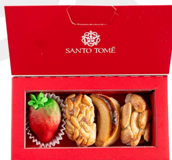
MINI CAJA OPCIÓN 4 PRECIO 7.15€ (IVA INCL.)