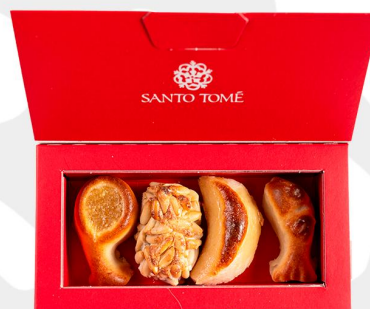
MINI CAJA OPCIÓN 2 PRECIO 6.05€ (IVA INCL.)