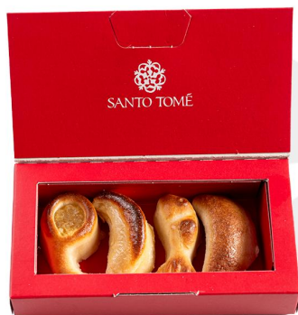
MINI CAJA OPCIÓN 1 PRECIO 4.40€ (IVA INCL.)

PERSONALICE SU EVENTO CON NUESTROS PACKS DE MAZAPÁN EN FORMATO MINI