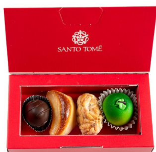
MINI CAJA OPCIÓN 3 PRECIO 6.60€ (IVA INCL.)